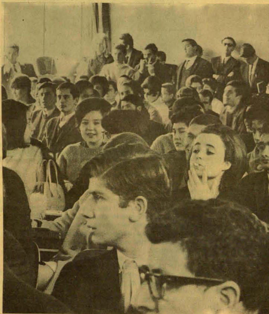
Abriendo camino al futuro

Como fruto de esta liberación, vamos construyendo el hombre nuevo y la sociedad socialista que anhelamos.