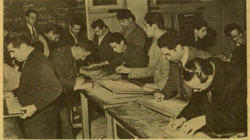
Capacitándose para responder

Por eso podemos decir que para los obreros, la gran escuela fue la vida, y las organizaciones obreras. Cada vez que respondimos a un desafío; que combatimos una injusticia, que fuimos solidarios con los compañeros en la lucha por conquistar nuestros derechos, que nos ingeniamos en formar nuestro hogar, que nos unimos para mejorar nuestra población, nos fuimos cultivando y aprendiendo algo más; fuimos adquiriendo las armas culturales y conocimientos para seguir enfrentando los desafíos posteriores.