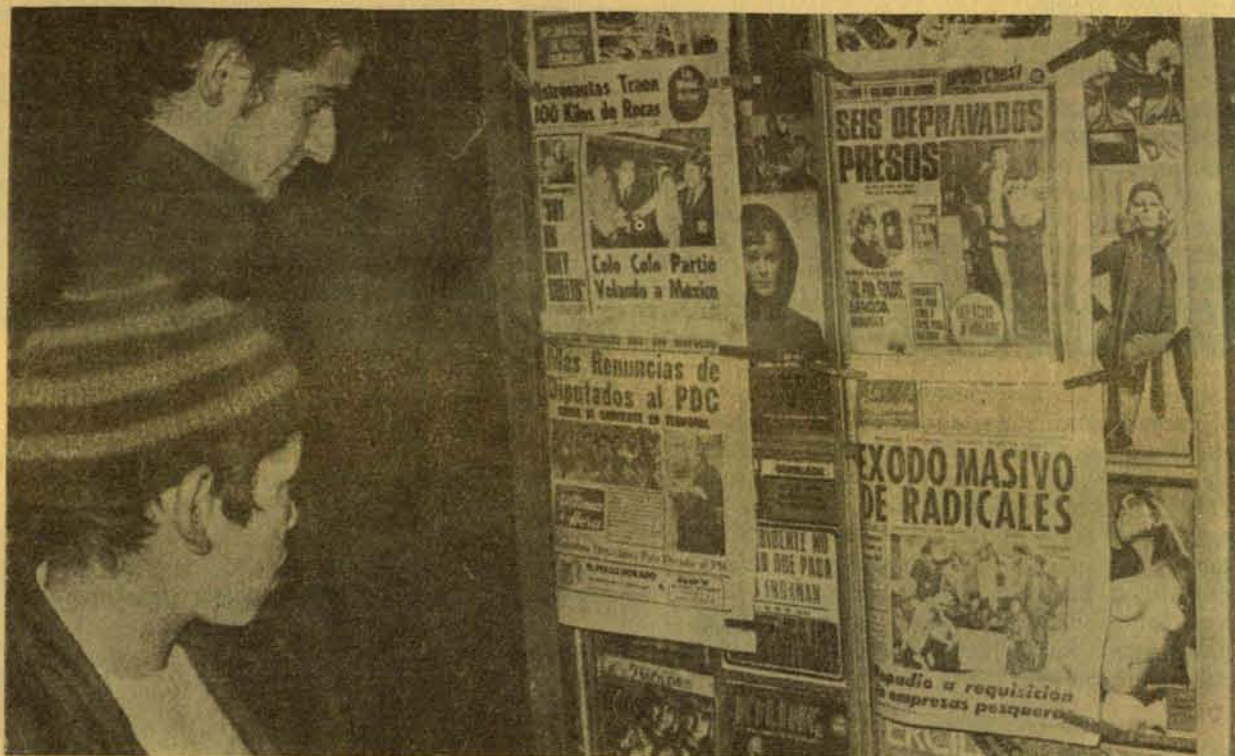
Colar "la paja molida" para quedarse con la verdad

Y no podemos juzgar el éxito o fracaso de un proceso revolucionario, porque haya o no cigarrillos Hilton o falta hilo blanco en las tiendas.