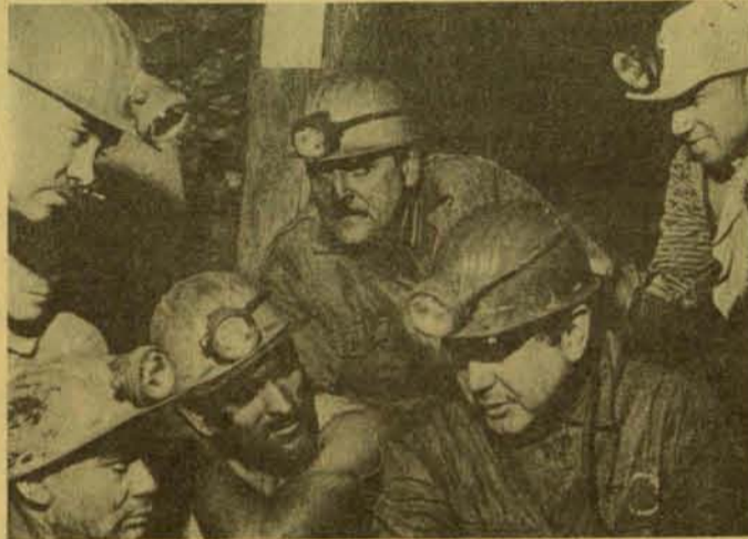
Organizándose para la conquista

Los trabajadores, que organizadamente luchan por estos objetivos, cualquiera que sea la organización en que militen, están continuando y haciendo realidad los ideales de todos los que murieron o fueron asesinados procurando un mundo menos injusto. A todos ellos saludamos en este 1° de mayo de 1972.