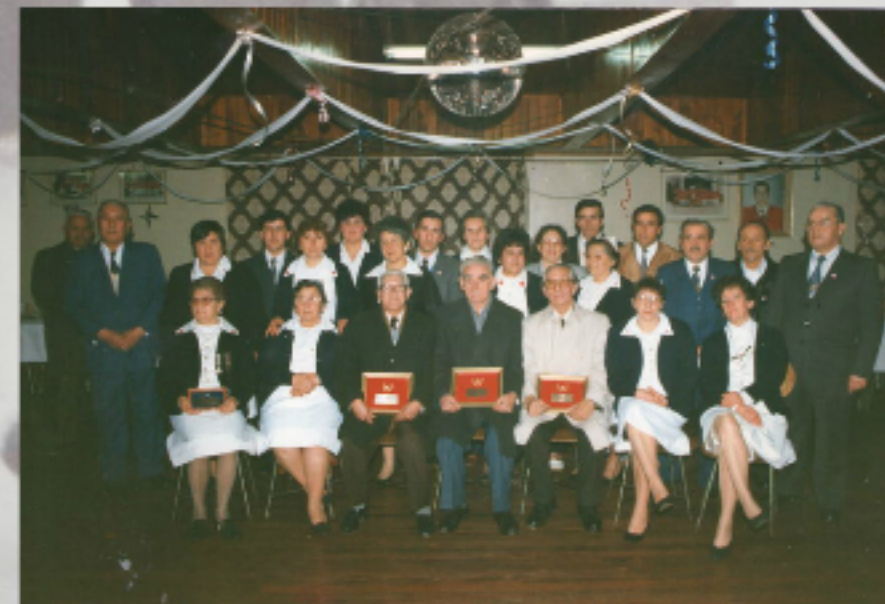
ENTREGA DE DISTINCIONES

Década 1980 / Entrega de galardones a voluntarios de la Cruz Roja de Río Bueno por sus años de servicio a la institución. // Donante: Luis Humberto Díaz