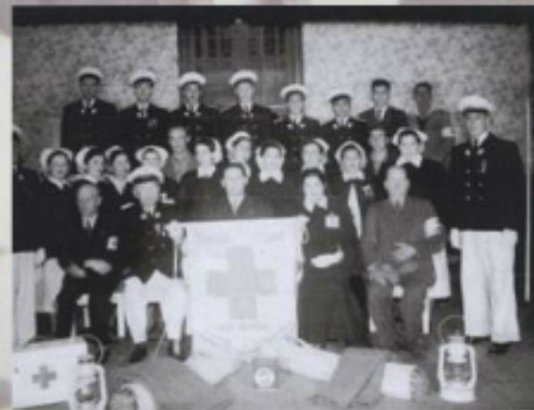
VOLUNTARIOS CON EQUIPOS DE CAMPAÑA

Década 1940/ Primeros voluntarios(as) de la Cruz Roja organización, ubicado en calle Pedro Lagos. // Donante