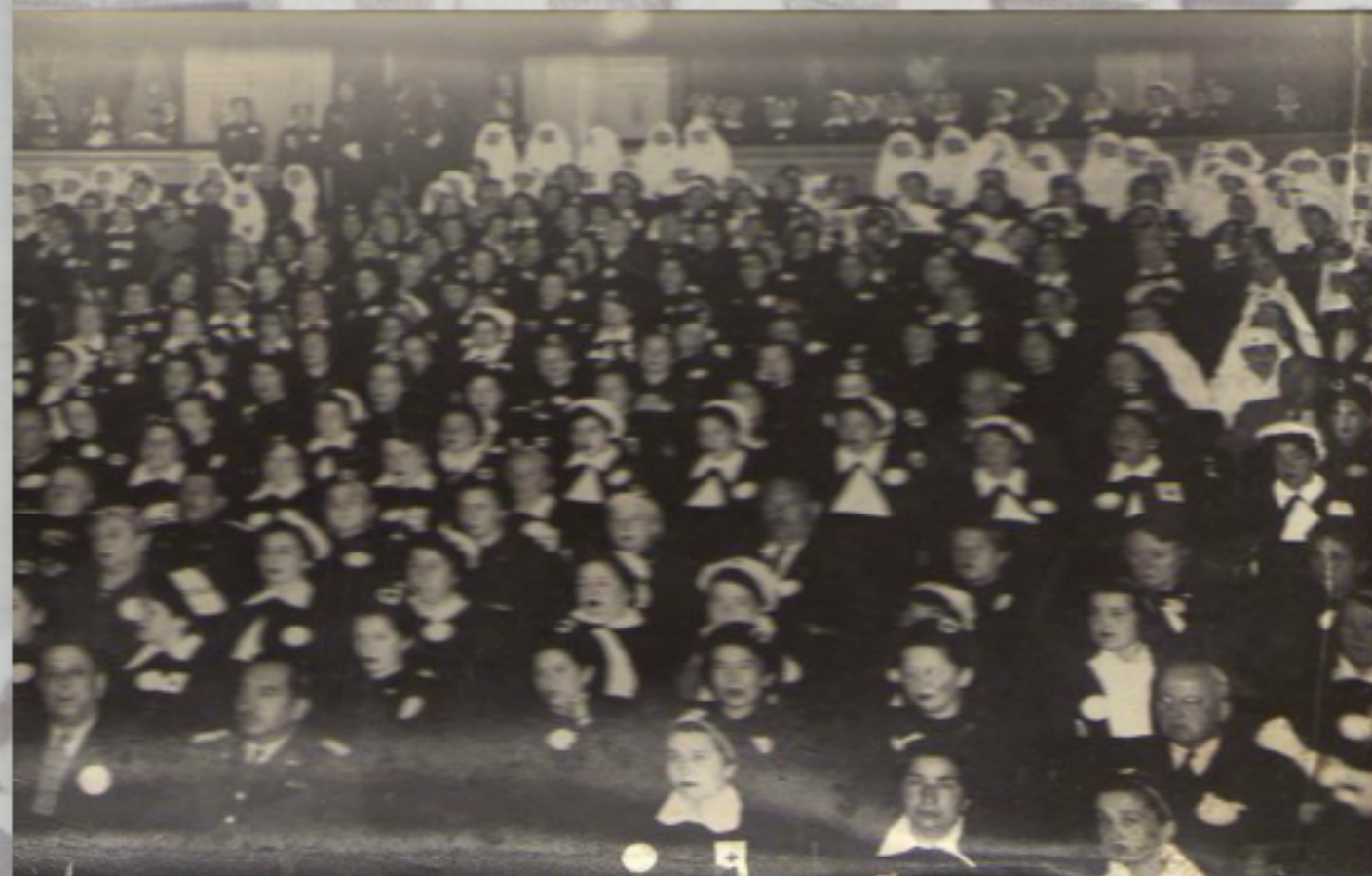
// Donante: Luis Díaz Sobarzo

Fotografía interior: Donante: Luis Díaz Sobarzo