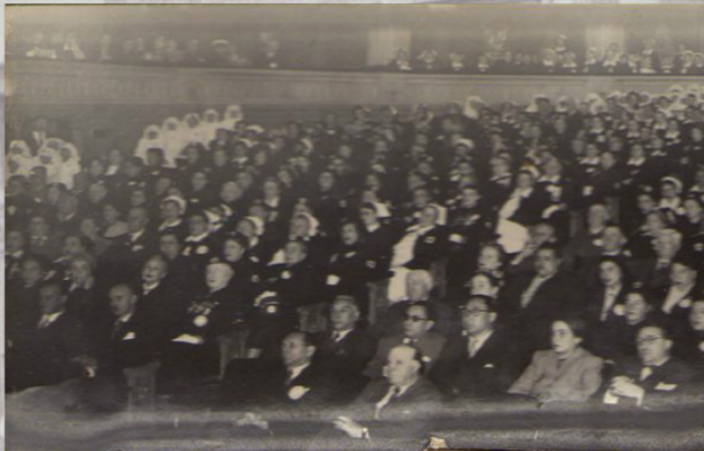
CONGRESO Década 1950 / Congreso Anual de la Cruz Roja de Chile realizado en el Teatro Caupolicán en Santiago de Chile. //