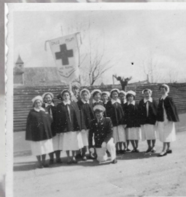
VOLUNTARIAS CRUZ ROJA

1957/ Cruz Roja de Río Bueno desfila un 18 de septiembre frente a la plaza de armas de la ciudad.