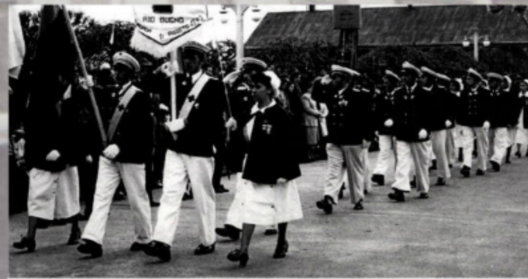
DESFILE EN PLAZA DE ARMAS

1949/ Grupo de camilleros de la Cruz Roja de Río Bueno llevan enfermo por calle Comercio esquina calle Esmeralda. Al fondo se observa la casa Castorene y Larre. Esta fotografía es parte del cortometraje "La Cruz Púrpura" de Armando Sandoval Rudolph. // Donante: Dpto. de Cultura de I. Municipalidad de Río Bueno