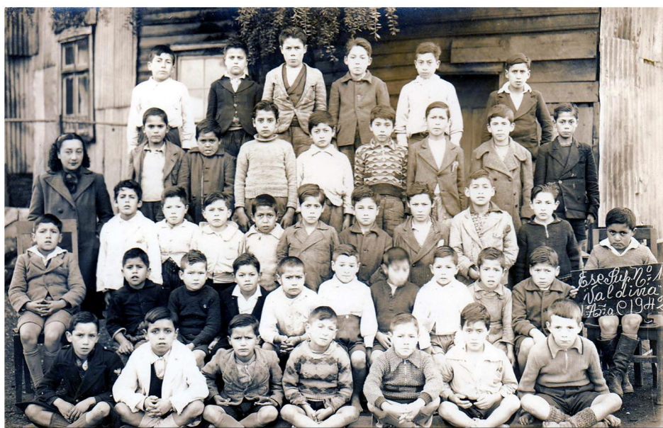
El 4° año básico de la Escuela n° 1 de Valdivia registra su fotografía anual junto a su profesora jefe. Fundada en 1834, actualmente es la Escuela Chile, una de las más antiguas del país. Valdivia, 1942.