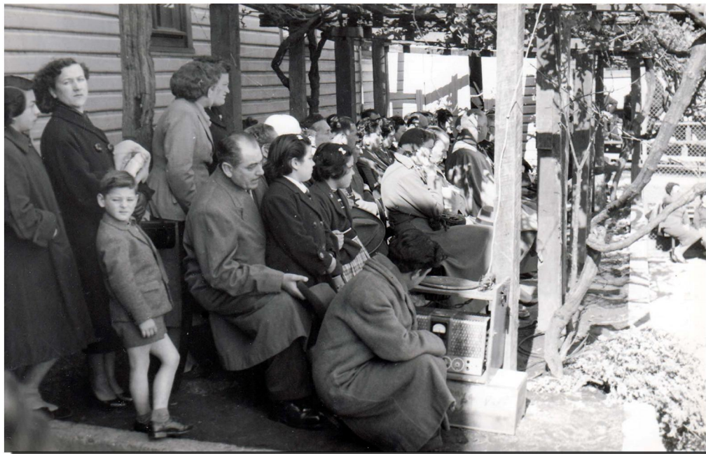
Revista de gimnasia en el Instituto Inmaculada Concepción. Un grupo de apoderados y de la comunidad presencian la revista que se realizaba en el patio del establecimiento. Valdivia, 1951.