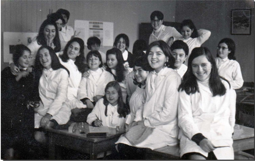
Un momento de relajó y risas. Estudiantes de 5° año básico del Instituto Inmaculada Concepción hacen una pausa en sus quehaceres escolares y posan para la fotografía. Valdivia, 1968.