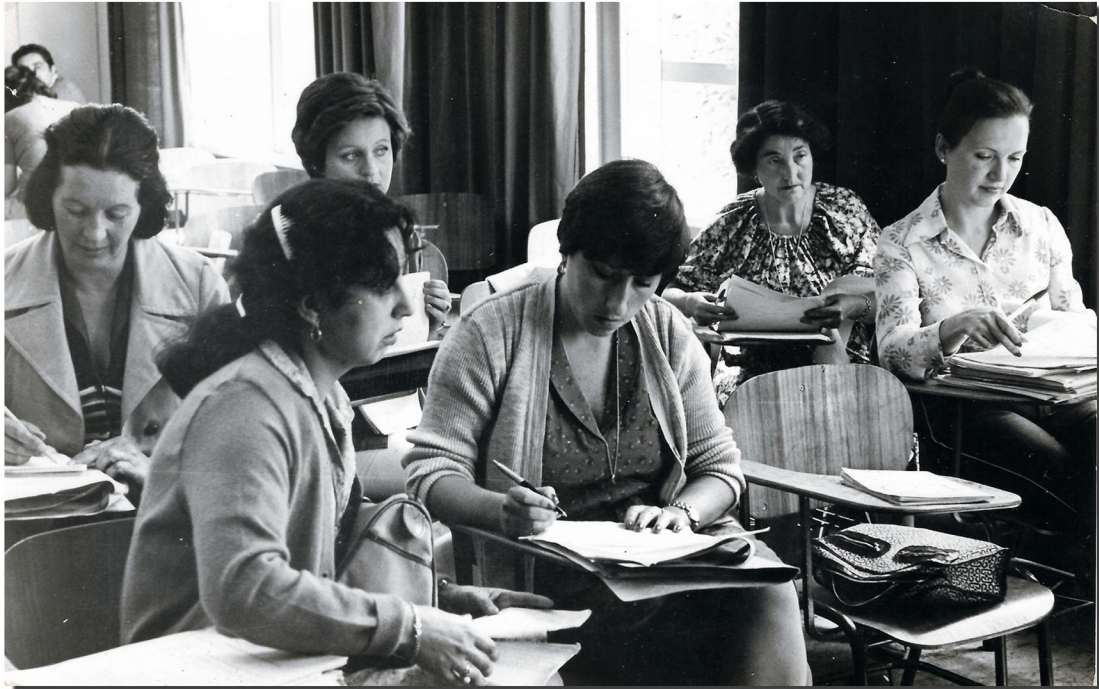
Curso de perfeccionamiento de docentes de la Escuela España, realizado durante el verano para reforzar competencias en diversos ámbitos de la pedagogía. Valdivia, 1970.