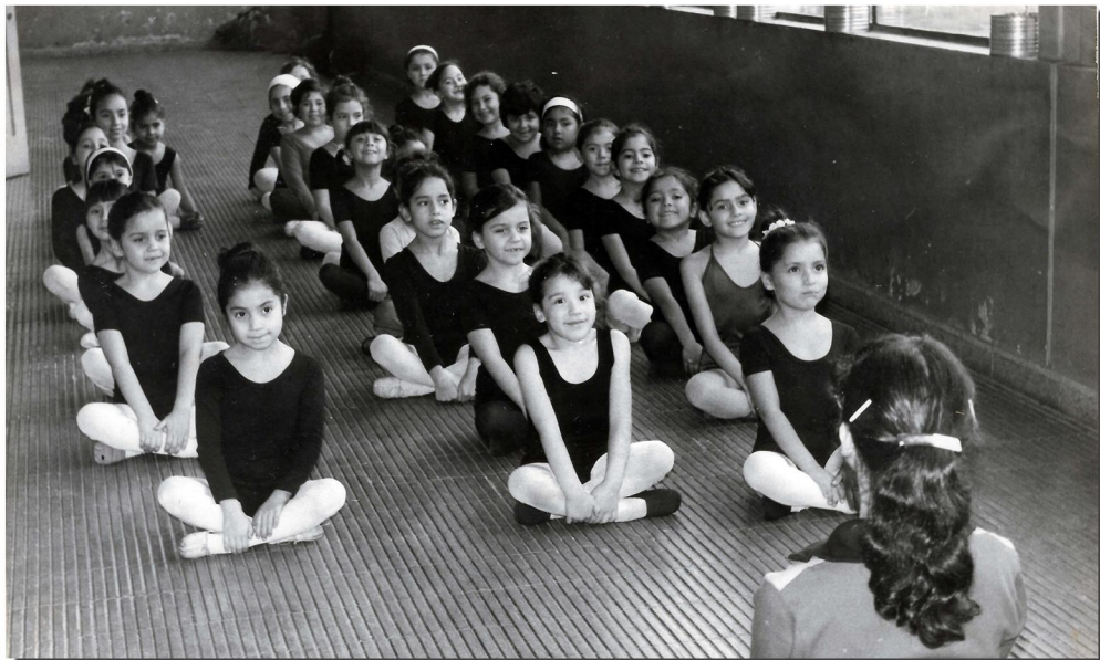
Clase de gimnasia rítmica en la Escuela España de Valdivia. Disciplina que por muchos años realizó esta escuela para desarrollar las habilidades y talentos deportivos, especialmente de las niñas. Valdivia, 1982.