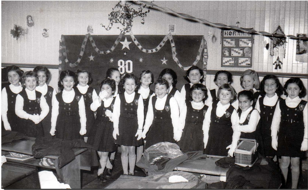
Estudiantes de 1° a 5° año de primaria del Instituto Inmaculada Concepción. Se preparan para algún acto oficial o celebración especial, ya que visten sus uniformes con guantes blancos. Valdivia, s/f.