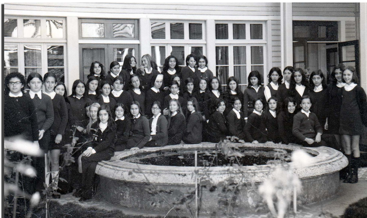
Grupo de estudiantes del Instituto Inmaculada Concepción posa junto a la fuente que aún permanece en el patio del colegio. Entre las alumnas una religiosa que probablemente era su profesora. Valdivia, 1973.