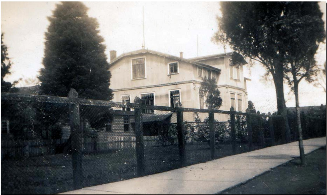
Edificio principal de la Escuela Normal Camilo Henríquez de Valdivia. Se ubicaba en ese entonces en la calle Simpson y posteriormente se trasladó a la calle Muñoz Herмосilla, en el sector regional. Valdivia, agosto de 1945.