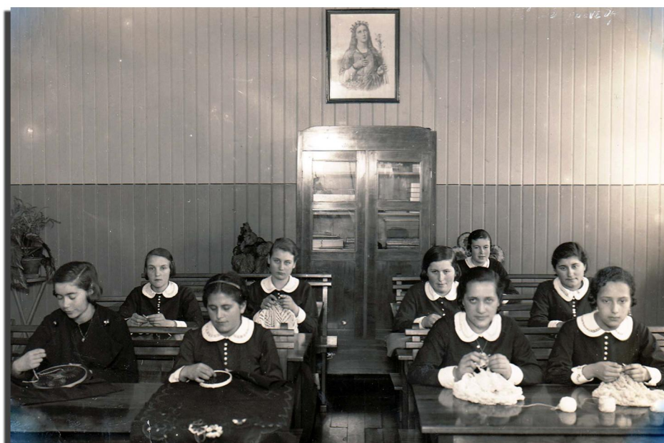
Un grupo de escolares del Instituto Inmaculada Concepción realizando labores manuales como tejido y bordado. Ésta era una asignatura tradicional que se llamaba 'economía doméstica'. Valdivia, s/f.