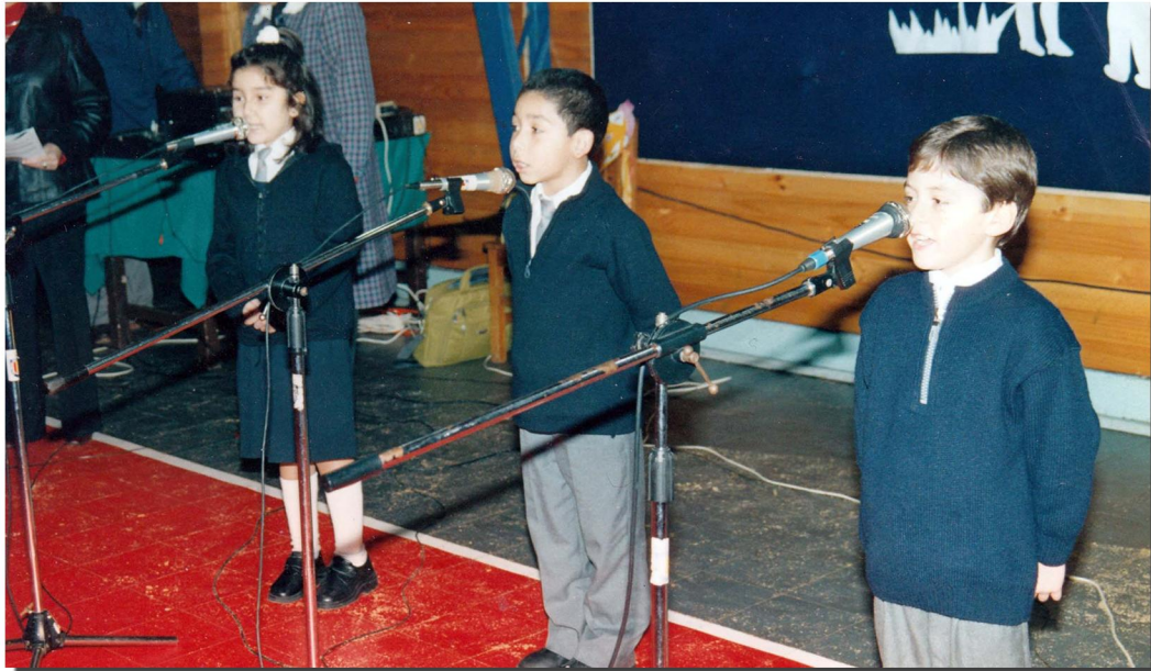
Acto del Día de la Madre en la Escuela España de Valdivia. Toda la comunidad educativa trabajó para una decoración especial y números artísticos, como es el caso de los tres niños que recitan. Valdivia, 2005 aprox.