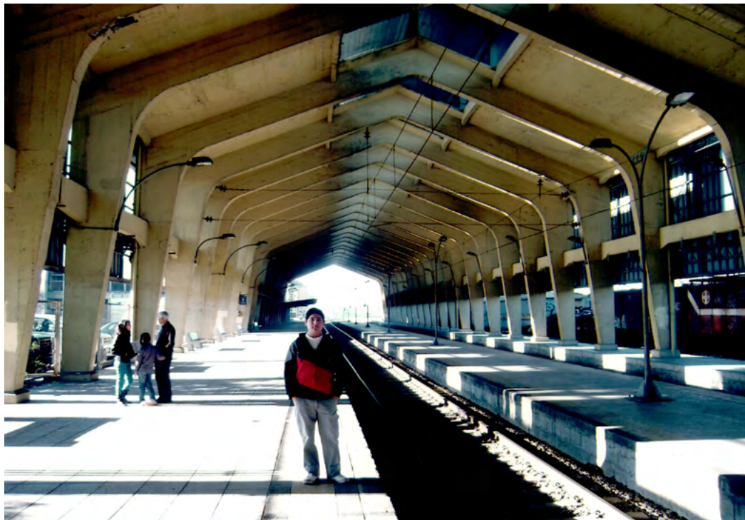
Jonathan en estación de ferrocarriles de Temuco.