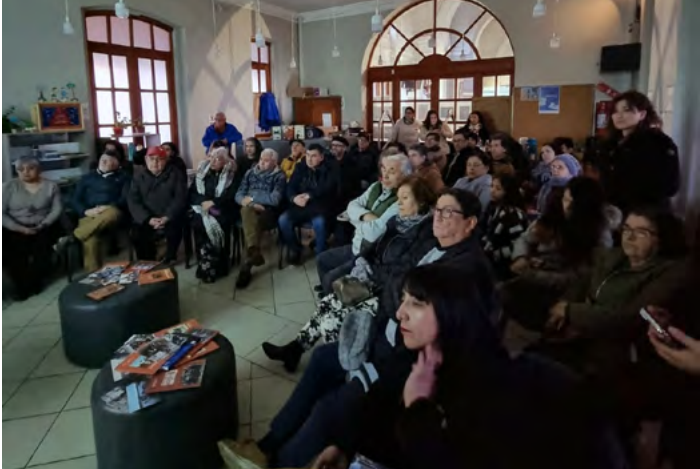
08 de agosto de 2024