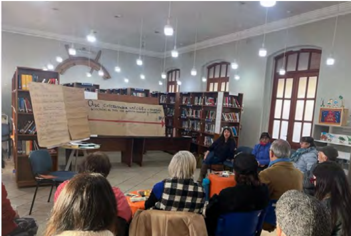
12 de septiembre de 2024